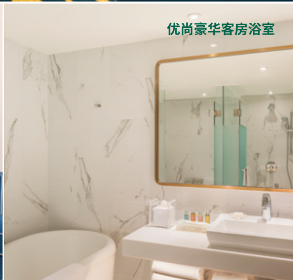
优尚豪华客房浴室